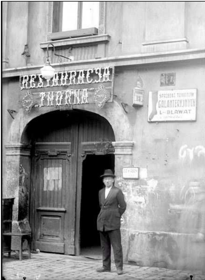
שער הכניסה לבית סוסר ברחוב קרקובסקה 13 ושלט המכריז על "מסעדת תורן"

לכו ברחובות גרודזקה ובסטרדום, שבו נמצא קולנוע "ורשה", הבלתי נשכח, בו התקיימו עצרות פוליטיות, כמו זו שבה נאם זאב ז'בוטינסקי לאחר רצח ארלזורוב. עלו ברחוב דיטלה, עורק התחבורה הנמשך מגז'גוז'ק ועד הויסלה, וכבר אתם נמצאים בלבו של הרובע היהודי לשעבר, קז'ימייז. כאן היתה מסעדת תורן (Thorn), וכאן עמד בית סוסר (Süsser) שבחצרו התכנסו ההמונים לעצרות מחאה – וסיבות לכך לא חסרו. לא היו מיקרופונים או רמקולים, והנאומים התנהלו בדיבורים רמים ממרפסת הבנין.