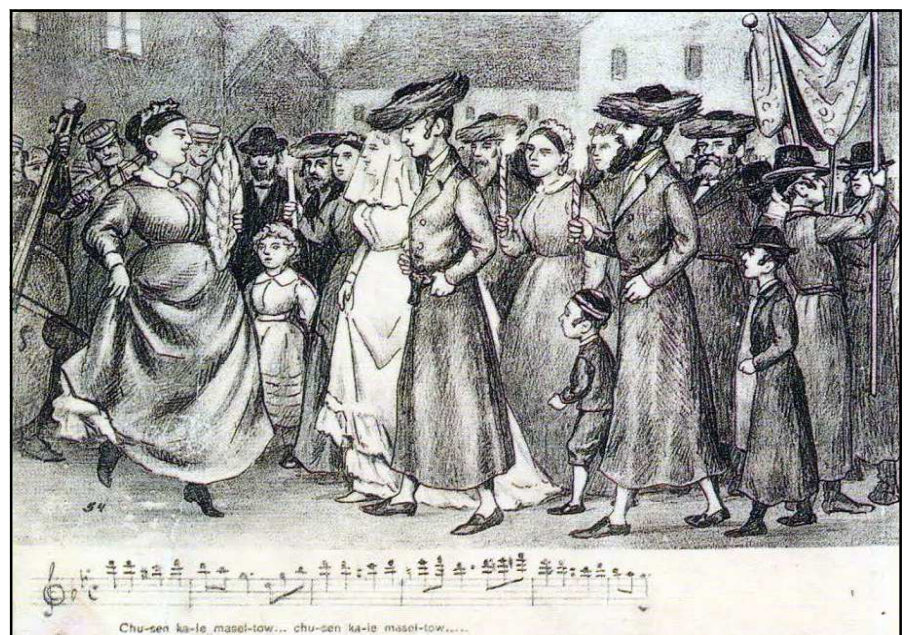
גלויה משנת 1912 המתארת חתונה יהודית (שימו לב לתווים שבתחתית הגלויה. מתוך פרוו של "Dawna pocztówka żydowska" E.M.Duda ב הוצאת המוזיאון ההיסטורי של קרקוב

על פי מאיר בוסק, "בין צללי העיר" עמ' 142-144