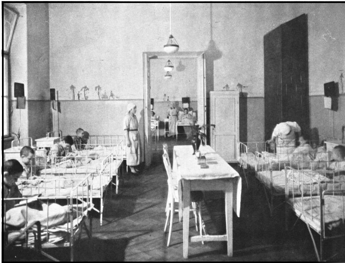
מחלקת הילדים בבית החולים היהודי

מהדוח לשנת 1936 אנו למדים כי 60% מהמאושפזים היו נשים; 65% מהמאושפזים היו תושבי קרקוב; ו-1% היו נוצרים. בשנת 1931 היו, על פי המפורסם בספר, כ-2,400 רופאים יהודים בקרקוב.