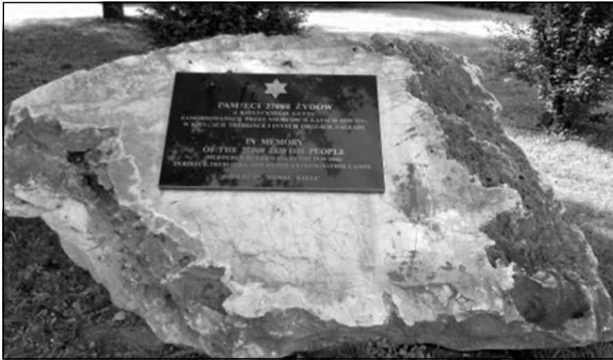
ליד בנין בית הכנסת שנחרב בידי הגרמנים ברחוב ורשבסקה 17 בקילצה הונחה אבן, ועליה שלט לזכר 27,000 יהודי קילצה והסביבה שנרצחו בידי הגרמנים בשנים 1939-1944. הכתובת בפולנית ובאנגלית.

מתוך הנתונים שנאספו עולה כי ברוב המקרים אתרי ההנצחה הנמצאים במרכזי הישובים