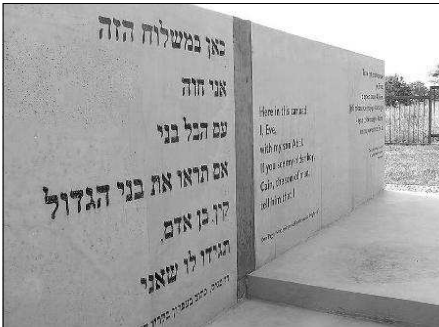
חלק מהאנדרטה במוזיאון בלז'ץ

תאי הגז הוסוו כמקלחות של המחנה, על מנת להטעות את קורבנות המחנה. אלה הורדו מהרכבות ואולצו לרוץ ישירות אל עבר תאי הגזים, על מנת שלא תהיה להם שהות להבין היכן הם נמצאים, או להתנגד. קומץ יהודים הושאר בחיים על מנת לבצע חלק מהעבודות הכרוכות בהשמדה – פינוי תאי הגזים, קבורת הגופות ומיון בגדי הקורבנות. העובדים היהודים – ה"זונדרקומנדו" – נרצחו גם הם אחת לתקופה, והוחלפו בעובדים מטרנספורטים חדשים. החל מ-17 במרץ ועד 8 בדצמבר 1942 פעלה מכונת ההשמדה במחנה, למעט הפסקה בין אמצע מאי לתחילת יוני 1942.