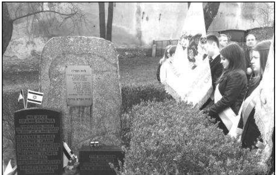
המצבה לזכר שבעת הנרצחים בטקס לציון שבעים שנה לארוע

ועל מה נתלה ישראל פריש הי"ד, אשר ניהל עסק לייצור ולמכירת