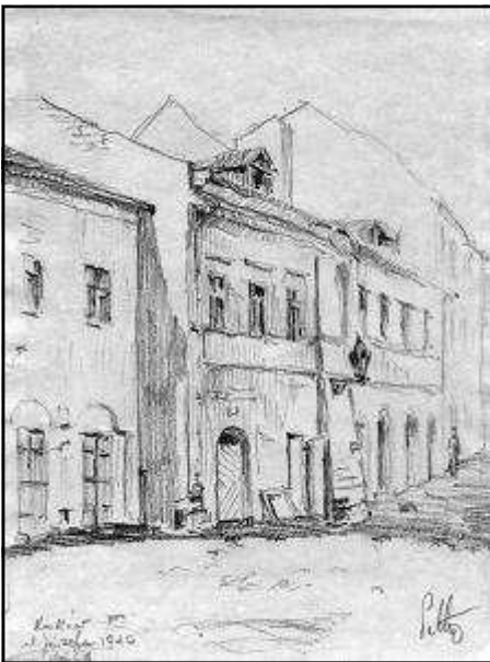
רחוב יוזפה בקרקוב ציור פרי עטו של אבי ז"ל מ-1946