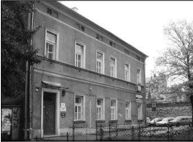
בית יולדות בככר גנרל שיקוסקי 6, צולם ע"י מרים רביד ב-2007

מרים רביד פליציה צלנר כותבות כי מדובר במרפאה ששכנה ב-Plac Generała Sikorskiego 6, ליד רחוב Jabłonowskich, שמששה בית יולדות לפני מלחמת העולם השנייה. אחרי המלחמה המקום הוסב לתחנת יעוץ לאם וילד (טיפת חלב) ולפני כמה שנים הפך למרפאה פרטית בה עוסקים כמה רופאים ברפואת משפחה.