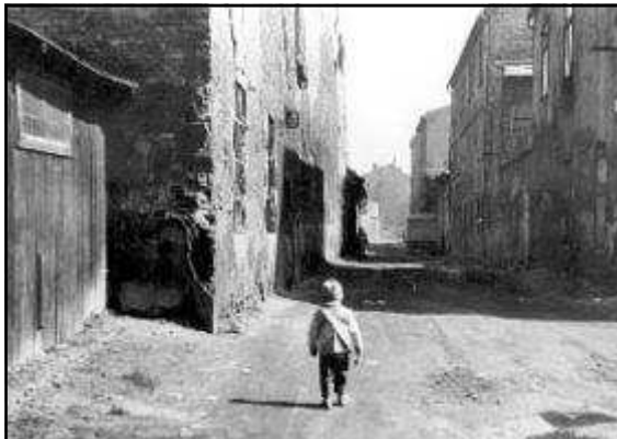
ילד יהודי ברחובות הגטו, קרקוב 1942

ומיוחדת היתה עיר זו – בירתה הקדומה של פולין, בית הנכאות ומחמדי המדינה, מקום הכרתם וקבורתם של מלכי הארץ, מושב האוניברסיטה היאגלונית – הראשונה במזרח אירופה, מפגש תרבויות של מזרח ומערב.