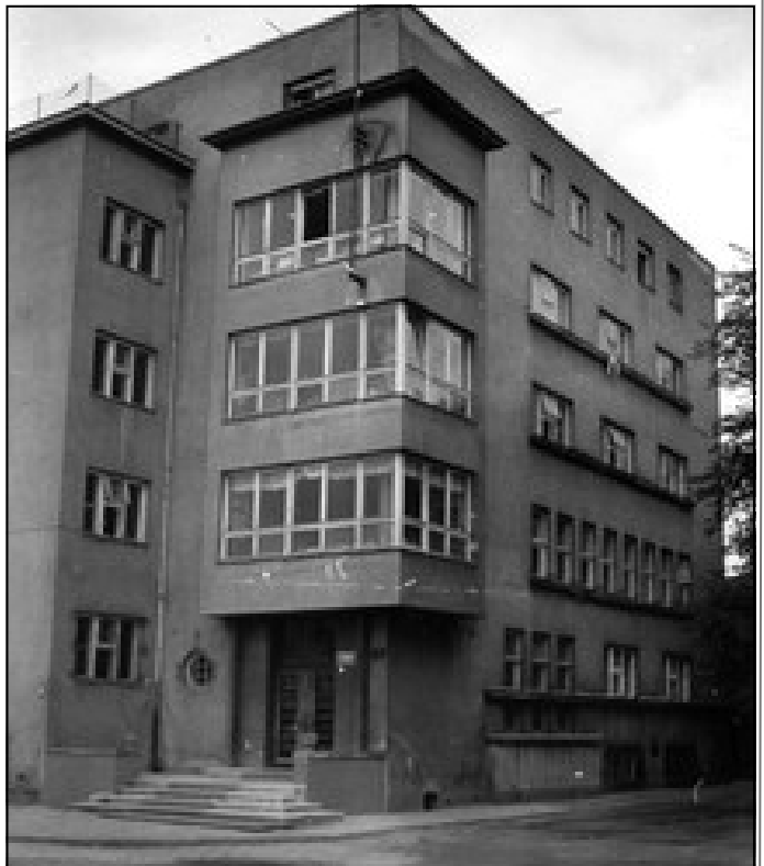
בית היתומים החל לפעול בבניין שברחוב אוגוסטיאנסקה בוצ'נה 1 בסוף 1945; הבנין נבנה בשנים 1938-1939 עבור בית זקנים בשם "אסיפת זקנים".

לפי באדן פאול, אלוף בריטי בעל עבר קרבי מפואר, פעילות הסקאוטים צריכה לחנך את הצעירים לערכים, לשמור על הקשר שלהם עם הטבע, לטפח את אופיים, להגן על בריאות נפשם, להעצים את כוחם הגופני ולעודד את מעורבותם החברתית.