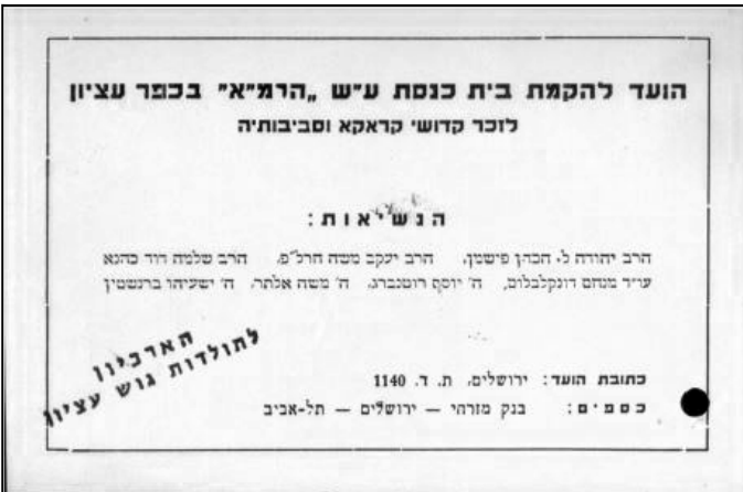
נשיאות הוועד להקמת בית הכנסת בכפר עציון

על מנת לקדם את היוזמה ולפרסמה ברבים, נבחרה נשיאות שבין חבריה היו מספר דמויות ציבוריות מוכרות: הרב יהודה לייב פישמן מימון, הרב יעקב משה חרל"פ,