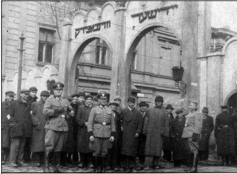
שער הכניסה לגטו

גזירות ומכות רבות נתכו מידי יום על היהודים בקרקוב ובימי מלחמת העולם השנייה. אחת מהן היא מכת הבוגדים והמלשינים. בספר היהודים בקראקוב: תקופת מלחמת העולם השנייה (1939-1945) נכתב כך: "חיי היהודים שהסתכנו לגור בקרקוב ה"ארית" בין הפולנים, היו גיהנום על פני אדמות, אם כי הגיהנום שלהם היה אחר מזה של היהודים שבגטו או במחנה פלשוב. אלה שהסתתרו, חיו בחרדה איומה ובלתי פוסקת פן יתגלה מחבואם, פן ילשינו עליהם או יסגירו (כי העונש היה מוות, להם, וכאמור, לגוי שגמל להם את החסד), או פן יבהל הגוי, ישנה את דעתו וישליך אותם לרחוב ויפקירם לנדידה ארוכה, מסוכנת, מייאשת, מתישה ממחבוא למחבוא, מגוי לגוי... – ואילו לאלה שסמכו על ה"מראה הטוב", ארבה הסכנה בכל שעה ובל מקום – פן מלשין, גוי "מכר" או תנועה,