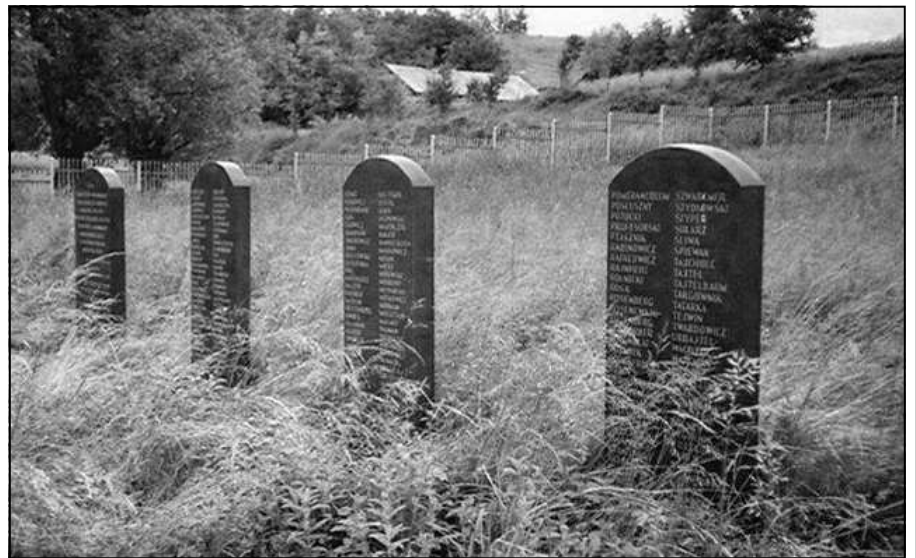
מצבות לזכר הנרצחים בבית הקברות בסלומניקי

בעת שעלינו למכוניות המשא, גילו אותם קציני אס.אס. כי בחור ממשפחת זיידנר הינו עיוור, והוא נורה בו במקום. הכרתיו מילדותי - משפחתו התגוררה בקצה הרחוב, הוא עסק בהרכבת מברשות, ואחיו הקטנים נהגו להובילו. הוריו ניסו להשאיר אותו בבית ונעלו את הדירה, אך לאחר שנשאר לבד החל להשתולל ולצעוק. בעלי הבית הגויים הצליחו להודיע על כך להורים, ואלה הגניבו אותו למקום הריכוז בבית הספר לבנות, שם התחבא בין הקהל. בבוקר השילוח התעורר והחל צועק: "שמעו, אני רואה: אור גדול אני רואה!". במצב הנואש היו כאלה שנתלו תקווה בדבר, תקווה שכמובן נכזבה כאשר