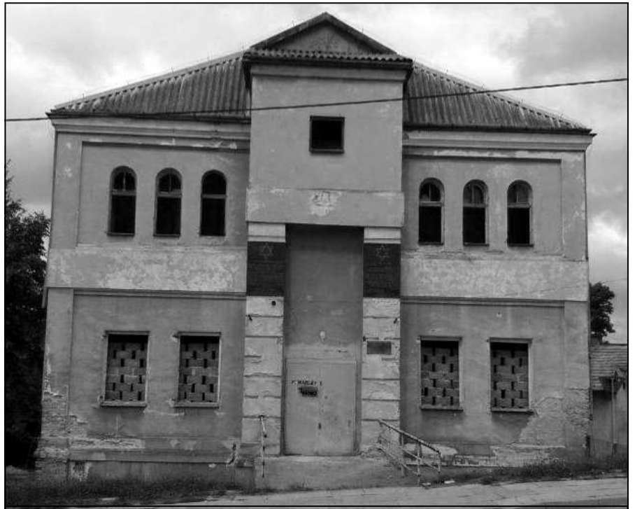
בית הכנסת בסלומניקי כפי שנראה בשנים האחרונות

בלילה בין ה-4 ל-5 ביוני הופרה שלות העיירה עם הגעת רכבים רבים: משמרות של משטרה גרמנית, משטרה מקומית פולנית, חיל עזר אוקראיני ואף מכבי האש המקומיים. ראש ועד