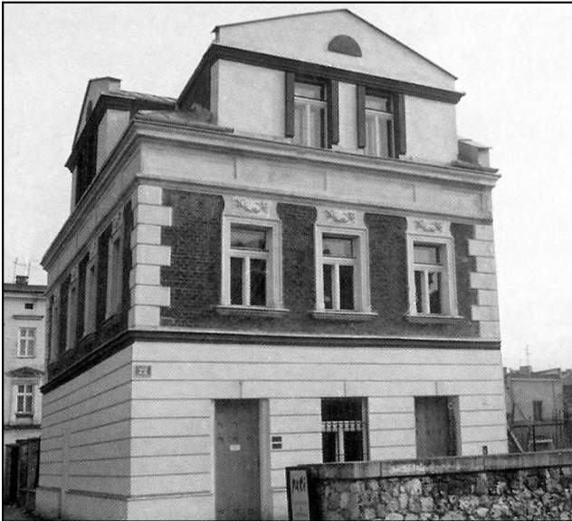
כאן עמד בית הכנסת "על הגבעה" שחרב ב-1941