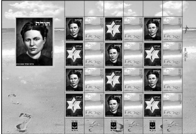
גליון בולים לזכרה של אירנה סנדלר, חסידת אומות העולם

סימפונט רעננה יחד עם עיריית רעננה, שגרירות פולין בישראל ואגודת ידידות ישראל-פולין החליטו להקדיש השנה פרויקט מיוחד לאירנה סנדלר ז"ל, האישה שהצילה 2,500 ילדים יהודים בזמן השואה. הפרוייקט יתקיים בשיתוף עם בני נוער מרעננה שיחשפו לפועלה של סנדלר, יעקבו אחרי תולדות הניצולים ומקום הצלתם ויעלו את רשמיהם על הכתב, כמעין מכתב תודה לאירנה.