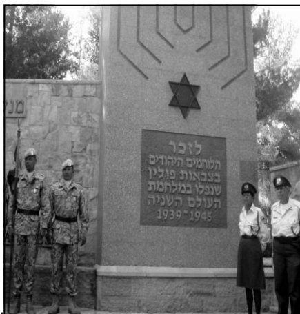
אנדטרה לזכר הלוחמים היהודים בהר הרצל