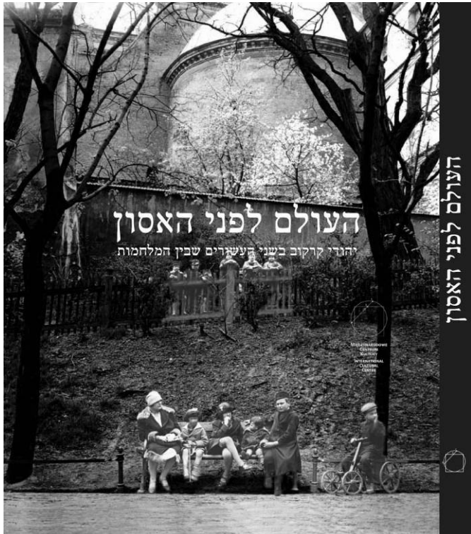
העולם לפני האסון

ב-21 בדצמבר 2008 בשעה 18:00 תפתח, במרכז מורשת בגין בירושלים, התערוכה יחודית "העולם לפני האסון". התערוכה מציגה את חייהם של יהודי קרקוב לפני החורבן והיא תהיה פתוחה עד לאחר חג הפסח.