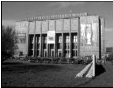
המוזיאון הלאומי ע"פ תכנון של קרייסלר ושפירא

וברחוב פבליקובסקי 6 (Pawlikowski) אחראי האדריכל איזידור גולדברגר. משרד האדריכלים של יזי שטרושקיביץ ומקסימיליאן בורשטיין ביצע, בשנים 1920-1936, את מרפאת נשים ומילדות ברחוב קופרניקה 23, בית הספר לסיעוד ברחוב קופרניקה 25, בית סטודטים לרפואה ברחוב גז'גוז'צקי 20 ובנין חברת הביטוח "פניקס" ברחוב בשטובה 13-15.