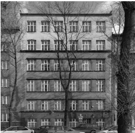
"בית יעקב", רח' סטניסלבה 10, קרקוב

והנה הסיפור המופלא: לאמי המנוחה, היפה בנשים, האלגנטית כמו נסיכה, היתה דודה עקרה, שאספה בנות אל ביתה ולימדה אותן תורה ודרך ארץ. שמה היה שרה שנירר, מייסדת תנועת "בית יעקב", ואולי ניתן להשוותה אל